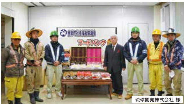
琉球開発株式会社様