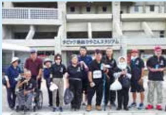
スポーツ大会へ参加

会員募集してます。 金武町内にお住いの身体障害者の方でなら誰でも会員になれます。年会費は1,000円です。