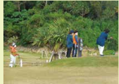
パークゴルフ交流会