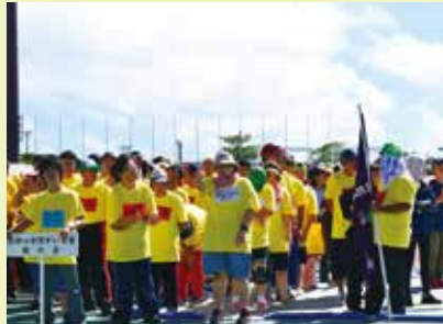
ゆうあいスポーツ大会