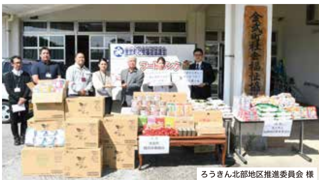
ろうきん北部地区推進委員会様