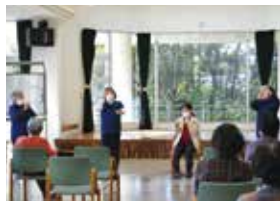
手話サークル雄飛