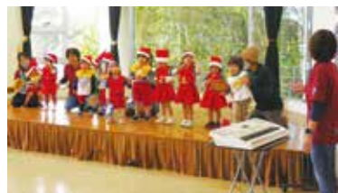
金武こどもみらい園