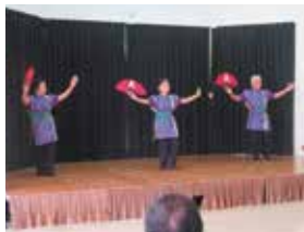
踊りサークルひまわり