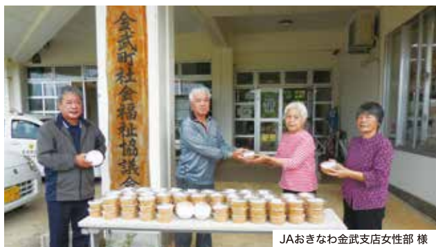
JAおきなわ金武支店女性部様