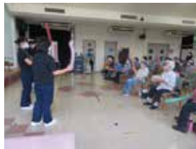
琉球リハビリテーション学院理学療法学科3年生