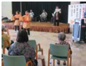
石川ヤッチーターと仲間ファミリー