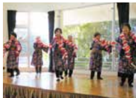
踊りサークル友輪