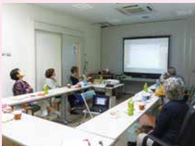
沖縄県精神障害者家族会連合会の「家族大会2022」にオンラインで参加

会員になれるのは、精神療養者の家族と目的に賛同する方です。年会費は1家族1,000円です。