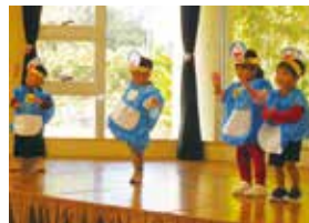
ららくる嘉芸小規模保育園