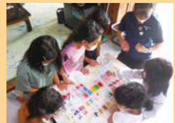
ワークショップを開催し地域の子ども達と交流