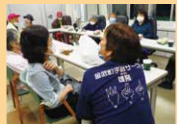
身体障害者福祉協会の活動でサポートをしています