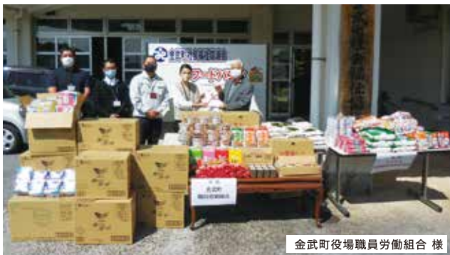
金武町役場職員労働組合様

ろうきん北部地区推進委員会様、琉球開発株式会社様、JAおきなわ金武支店女性部様、金武町役場職員労働組合様、金武町役場様からフードバンクへ食料品の寄附が寄せられました。いただいた食料品は2月28日にひとり親世帯や子育て世帯をはじめ、さまざまな理由から食費を必要としている方に無料で配布しました。