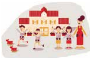
子どものための福祉事業