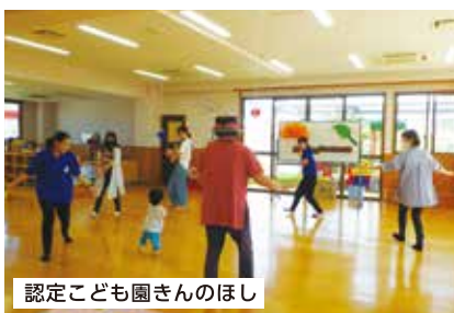
認定こども園きんのほし