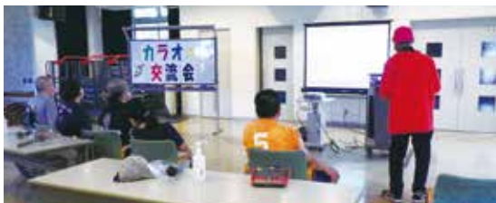
障がい者のカラオケ交流会