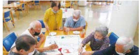
高齢者生きがい活動事業所