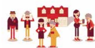
障害者のための福祉事業