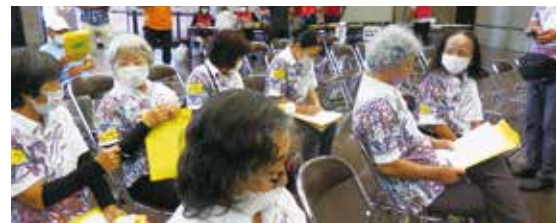
民生委員・児童委員の視察研修