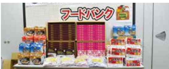
フードバンク事業