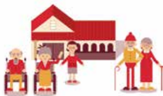
高齢者のための福祉事業