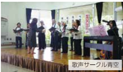
歌声サークル青空