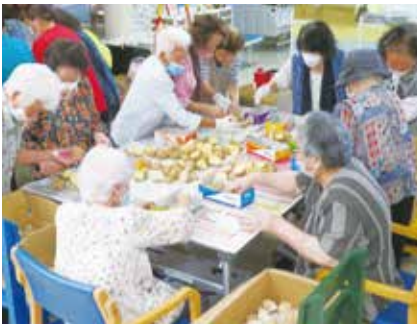
種芋作りをするデイサービスの利用者