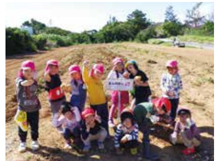
認定こども園きんのほし