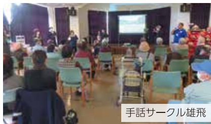
手話サークル雄飛