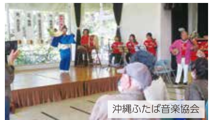
沖縄ふたば音楽協会