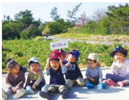
金武こどもみらい園