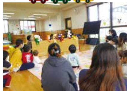
3月 金武こどもみらい園