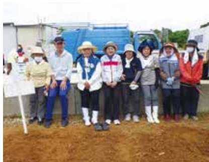
植え付けに参加した民生委員