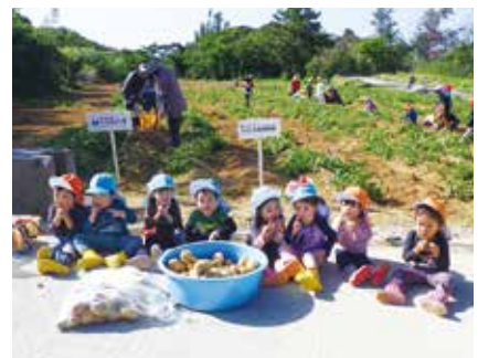
ららくる屋嘉保育園