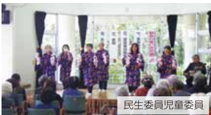
民生委員児童委員